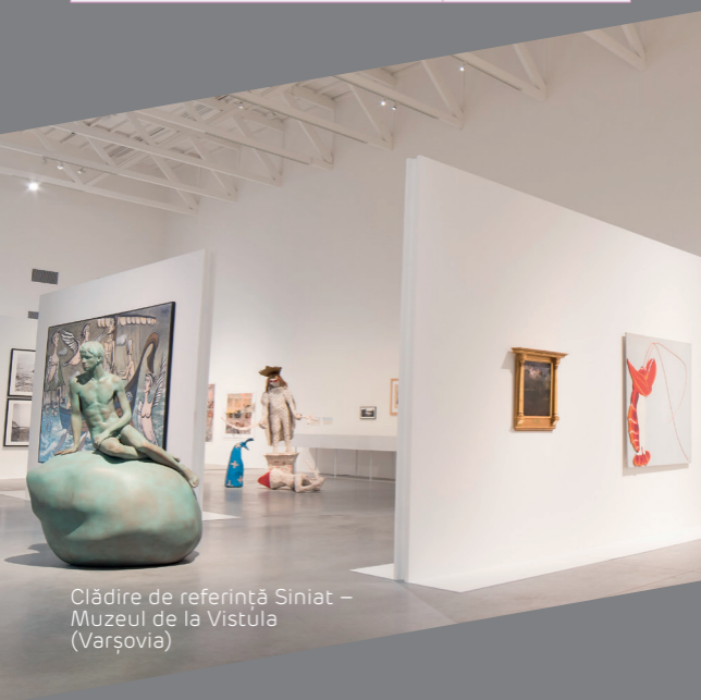
Clădire de referință Siniat – Muzeul de la Vistula (Varșovia)