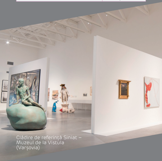
Clădire de referință Siniat – Muzeul de la Vistula (Varșovia)